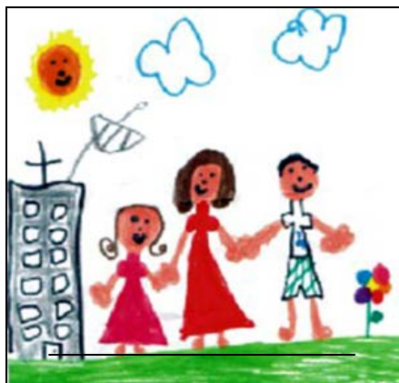
Artista: M. M- 6 anos