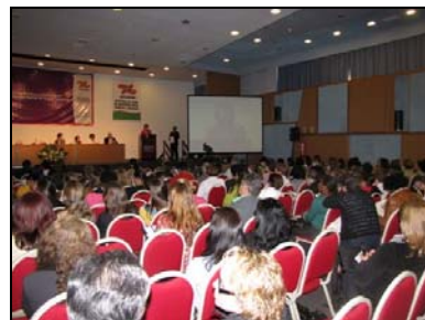
Plenária da Conferência Estadual de Assistência Social de Santa Catarina

Além de avaliar e propor diretrizes para o aperfeiçoamento do SUAS na perspectiva da participação e do controle social, a VII Conferência também elegeu os 50 delegados que vão representar Santa Catarina na VII Conferência Nacional que acontece no final do mês de novembro e início de dezembro em Brasília.